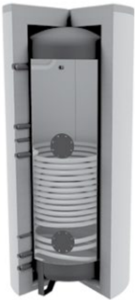
Emailboiler mit 1 WT