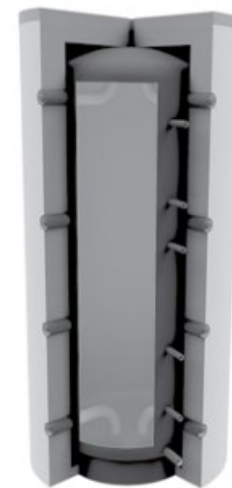
Pufferspeicher ohne Wärmetauscher