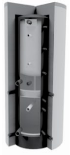
WP ohne Wärmetauscher