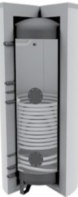
Emailboiler mit 1 WT